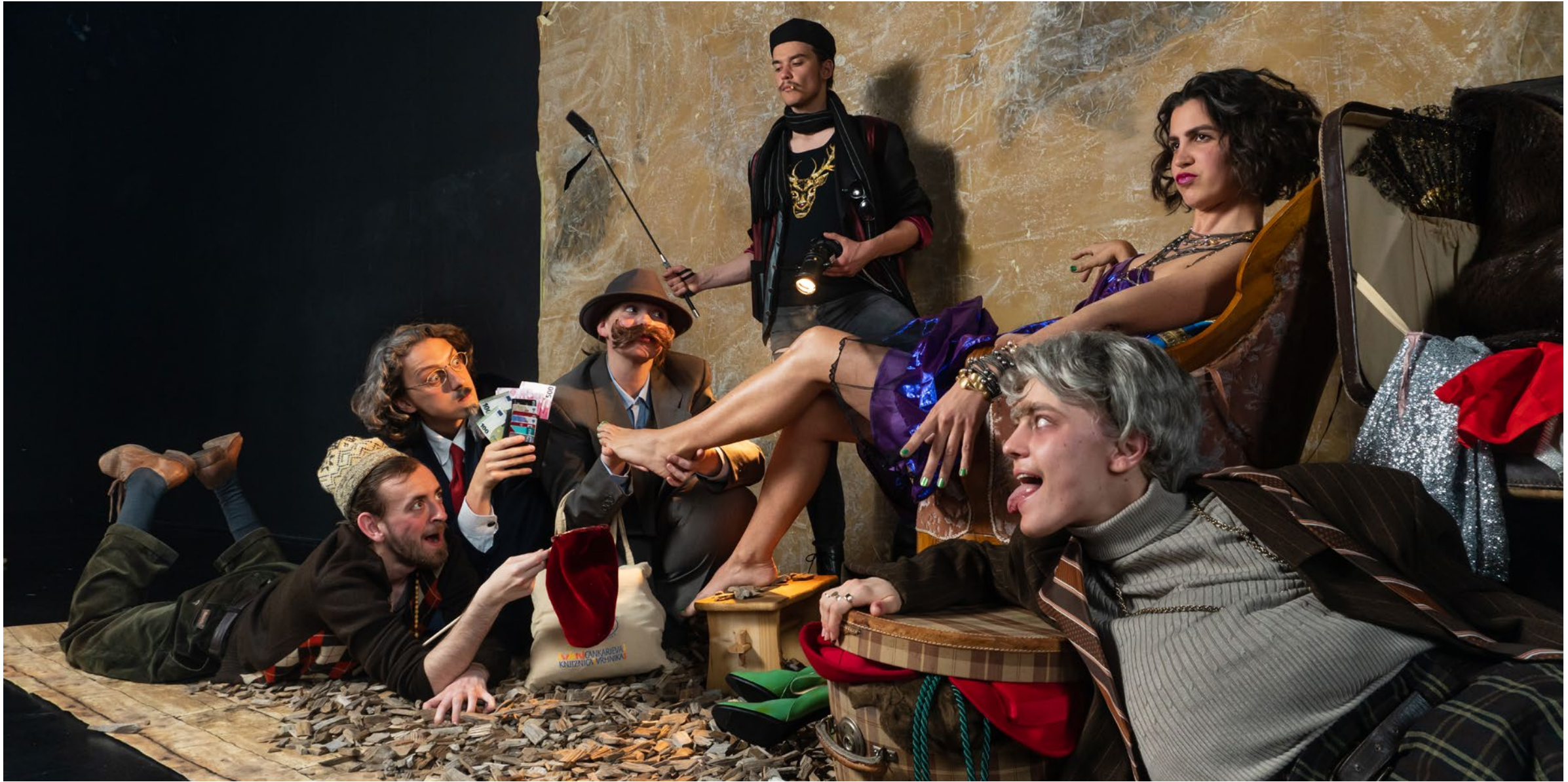
Pohujšanje v dolini šentflorjanski, druga slika, 2023