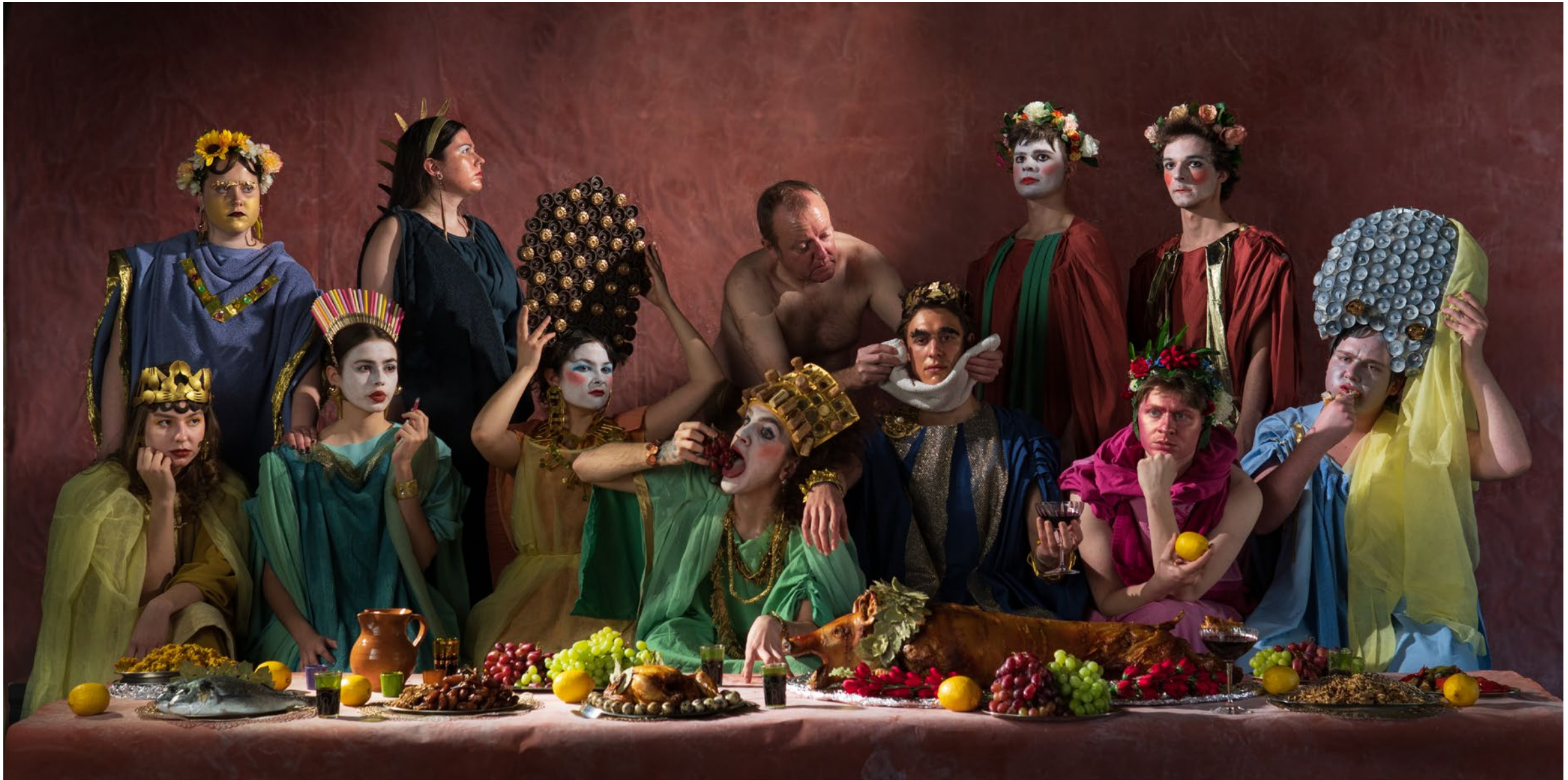
Pojedina pri Trimalhionu, 2023