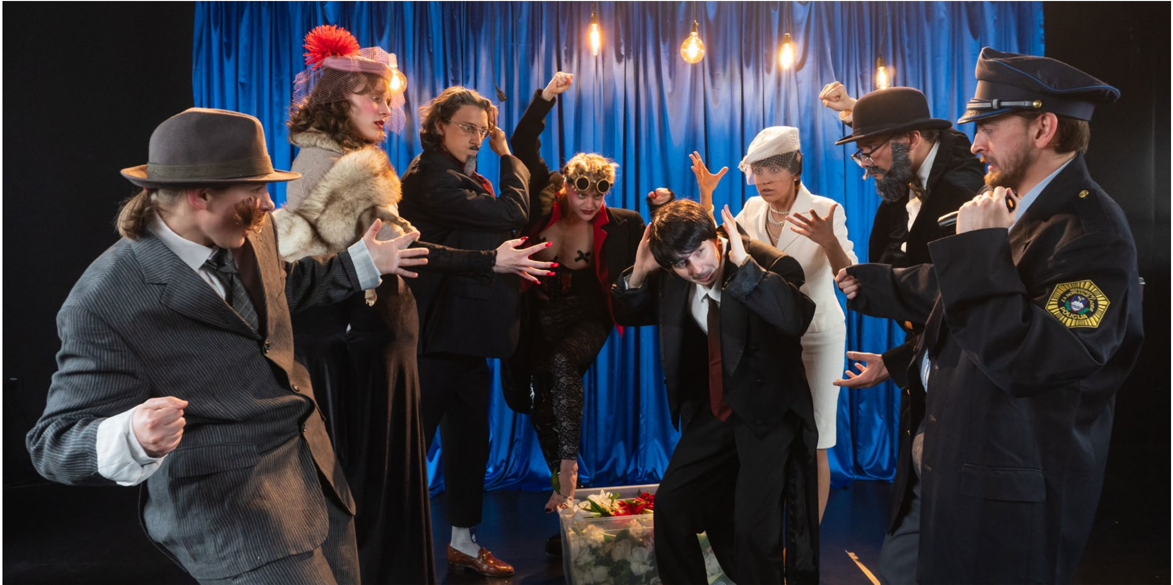
Pohujšanje v dolini šentflorjanski, tretja slika, 2023