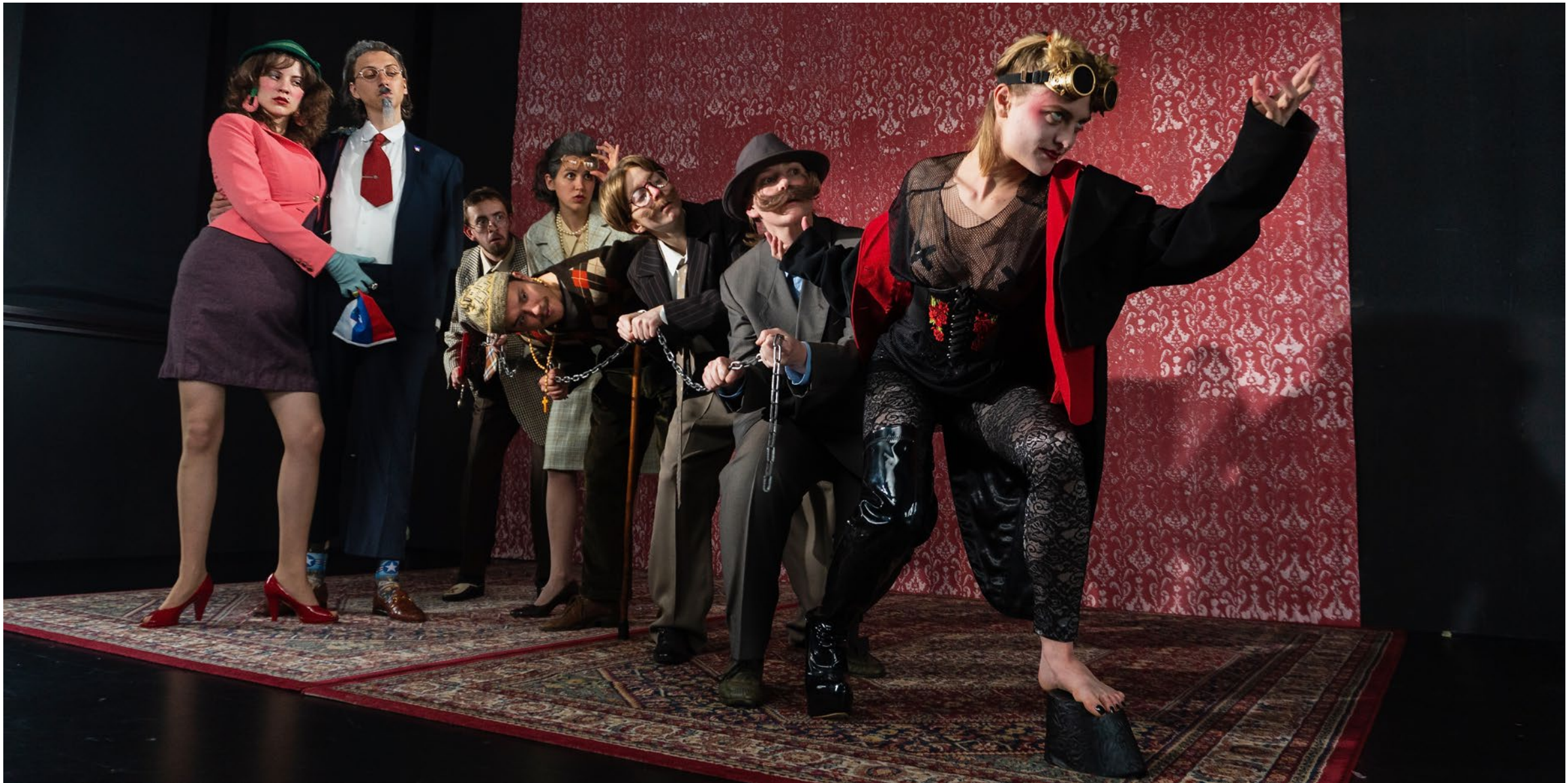
Pohujšanje v dolini šentflorjanski, prva slika, 2023